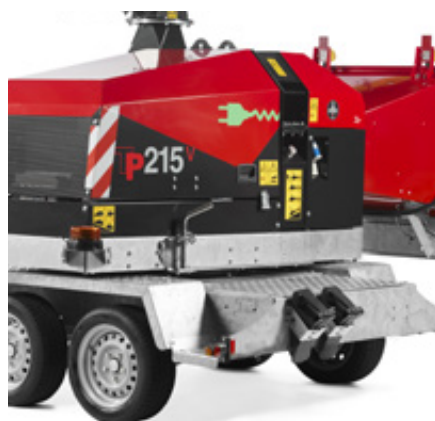
Mechanisch draaiplateau 225°