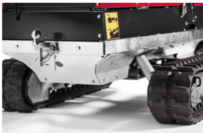
Bodemvrijheid van 200 mm, eenvoudig onderhoud en versterkte slangbescherming. Variabele breedte 1.150-1.350 mm