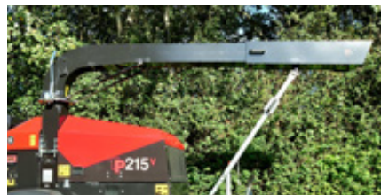
Telescopische uitloop is een optie