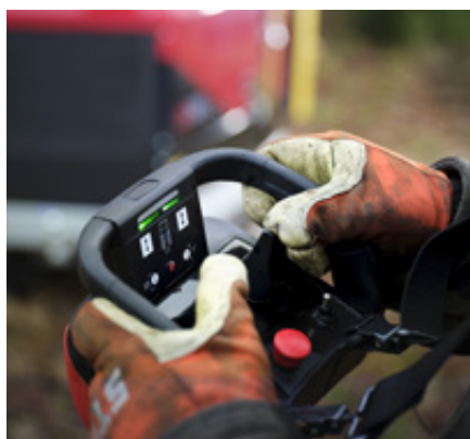
Danfoss afstandsbediening voor flexibiliteit