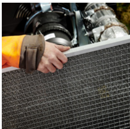
Filter voor eenvoudig schoonmaken