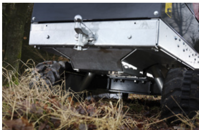
Bodenvrijheid van 250 mm, eenvoudig onderhoud en versterkte slangbescherming. Variabele breedte