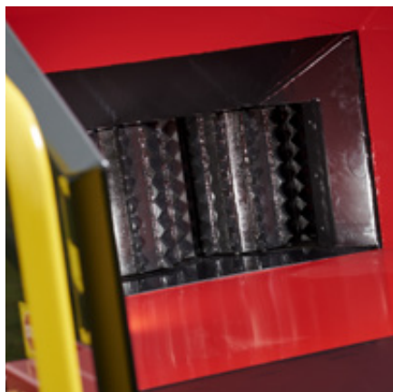
Verticale invoerrollen van TP Forest Design

De TP 280 Mobile is een "inliner". Dankzij de verschillende mogelijkheden voor het onderstel en de dissel, kunt u de TP 280 Mobile naar wens uitrusten.