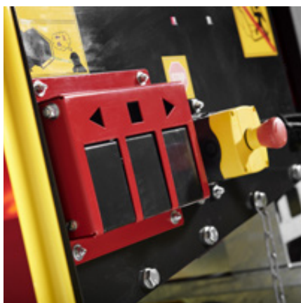
TP Easy Control met Reset – Reserve – Go-functie