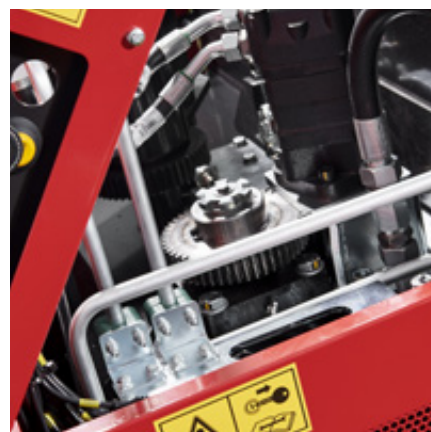
Danfoss hydraulische motor