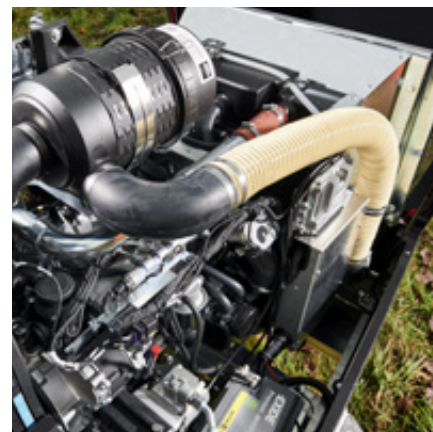
Hatz 4H50 Stage V motor met 55 kW