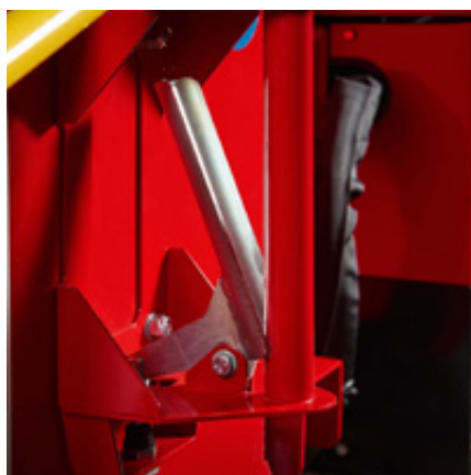
Ergonomisch ontwerp met eenvoudige handgreep voor het snel en veilig draaien van de versnipperaar