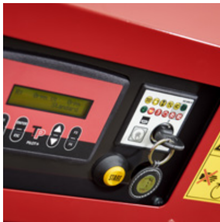
Gebruikersinterface met bediening en TP Starter