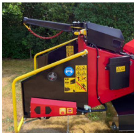
Hydraulische lier (optioneel)