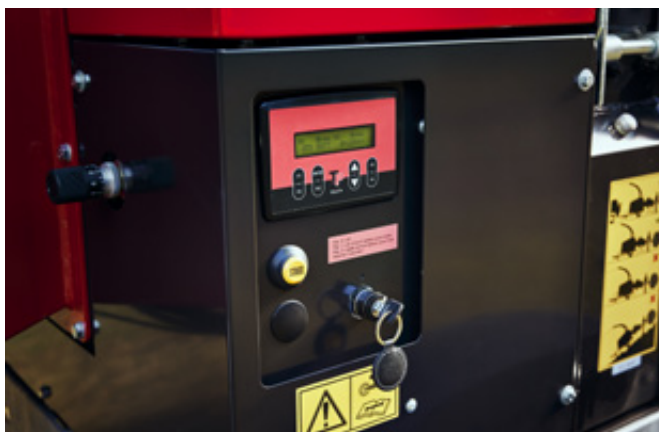
TP Pilot+, eenvoudig in gebruik en toch met uitstekende functies voor dagelijks werk