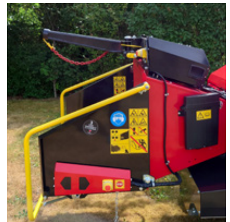
Een hydraulische lier is een optie voor alle TP 215 mobiele en rupsbandmodellen