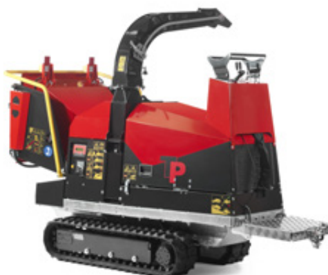
Handmatige bediening en platform