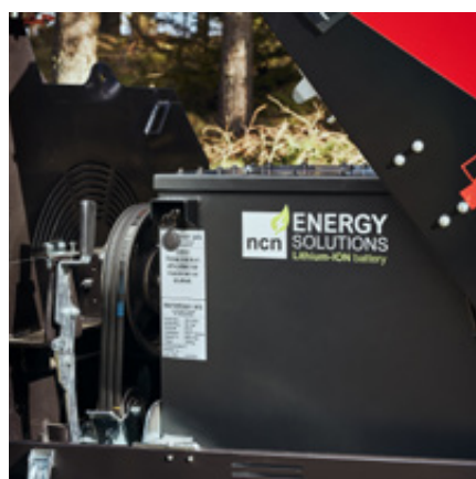
Krachtige 44 kWh accu