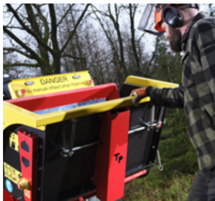
Eenvoudige bediening van de versterkte heavy-duty trechter dankzij gasveer